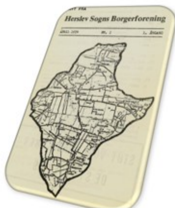
Forside Borgerbladet 1978

Men husk – gode artikler modtages med tak!